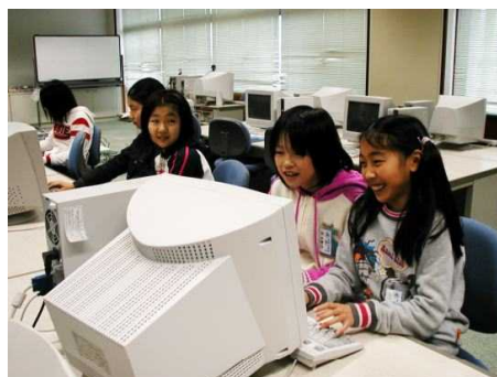
パソコンクラブの子どもたち

大洲小学校では、今年度初めてパソコンクラブが誕生しました。メンバーは4年生が7人、6年生が3人で、月2回程度の活動をしています。インターネットで色々なことを調べたり、初めてホームページづくりにも挑戦しました。